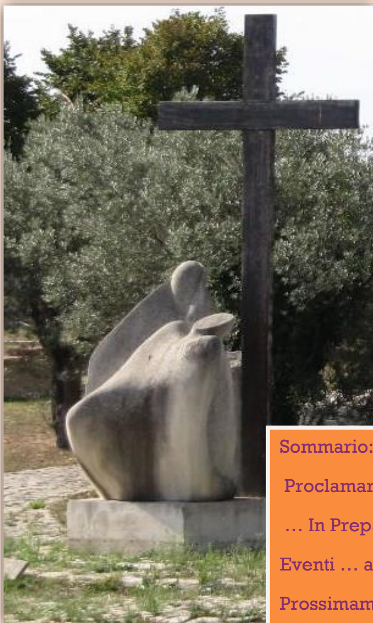
Deposizione dalla Croce

Periodico della Basilica – Santuario S. Maria dei Miracoli di Casalbordino