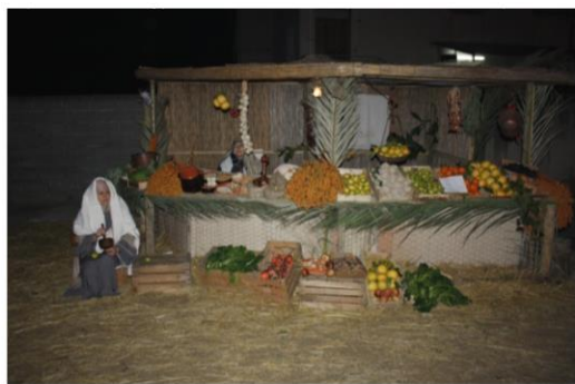
“Bancarella” di frutta e verdura