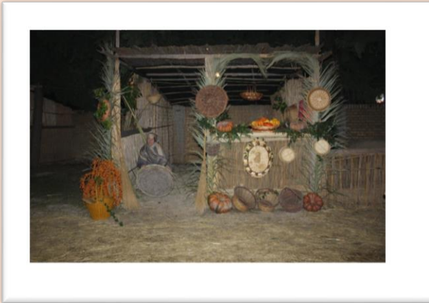
Bottega di una cestaia