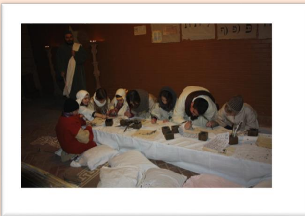
Alcuni bambini nella Scuola Ebraica